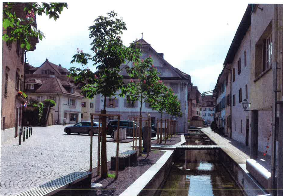
Sursee mit sanierter Altstadt und optimiertem Kanal: ein Masterplan zur Verbesserung des Hochwasserschutzes an der Sure.

3 «Gewässerraum im Siedlungsgebiet eröffnet neue Chancen», in ZUP Wasser, Kanton Zürich 2014.