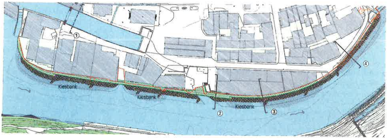
Hochwasserschutzmassnahmen an der Aare, Abschnitt Mattequartier: ① beidseitige Schutzmauern bis Schutzkote, ② linksufrige Schutzmauer (vgl. Plan unten), ③ Schutzmauer auf Höhe HQ100, ④ Schutzmauer bis Schutzkote, -- bisherige Uferlinie. Mst. 1:2500.

(HQ100) mit 600 \text{ m}^3/\text{s} Abfluss schadlos übersteht. Die Umsetzung in der Berner Matte weicht leicht davon ab: Die Krone der Ufermauer wird auf den HQ100-Pegel ausgelegt. Das sonst übliche Freibord, das bis zum HQ300-Ereignis (mit Abfluss 660 \text{ m}^3/\text{s} ) schützt, muss jedoch mit mobilen Schutzelementen abgeriegelt werden. Daher muss die Berufsfeuerwehr bei jedem Einsatz prüfen, ob die Schutzmauern mit Dammbalken zu erhöhen sind. Die angemessene Mauerhöhe wurde in einer städtebaulichen und ästhetischen Abwägung bestimmt. «Die Quartiere dürfen auf keinen Fall eingemauert werden», erklärt Toni Weber, w+s Landschaftsarchitekten, die gestalterische Leitidee im Hochwasserschutzprojekt. Die Bearbeitung ist dabei an ein interdisziplinäres Team aus Wasserbauspezialisten, Landschaftsarchitekten und Städtebauern übertragen worden. Und im Vorfeld haben behördeninterne Aussprachen mit der Eidgenössischen Natur- und Heimatschutzkommission und der Eidgenössischen Kommission für Denkmalpflege stattgefunden, damit die bauliche Hochwasservorsorge in nächster Nähe zum Weltkulturerbe, der Berner Altstadt, visuell möglichst schadlos umgesetzt wird.