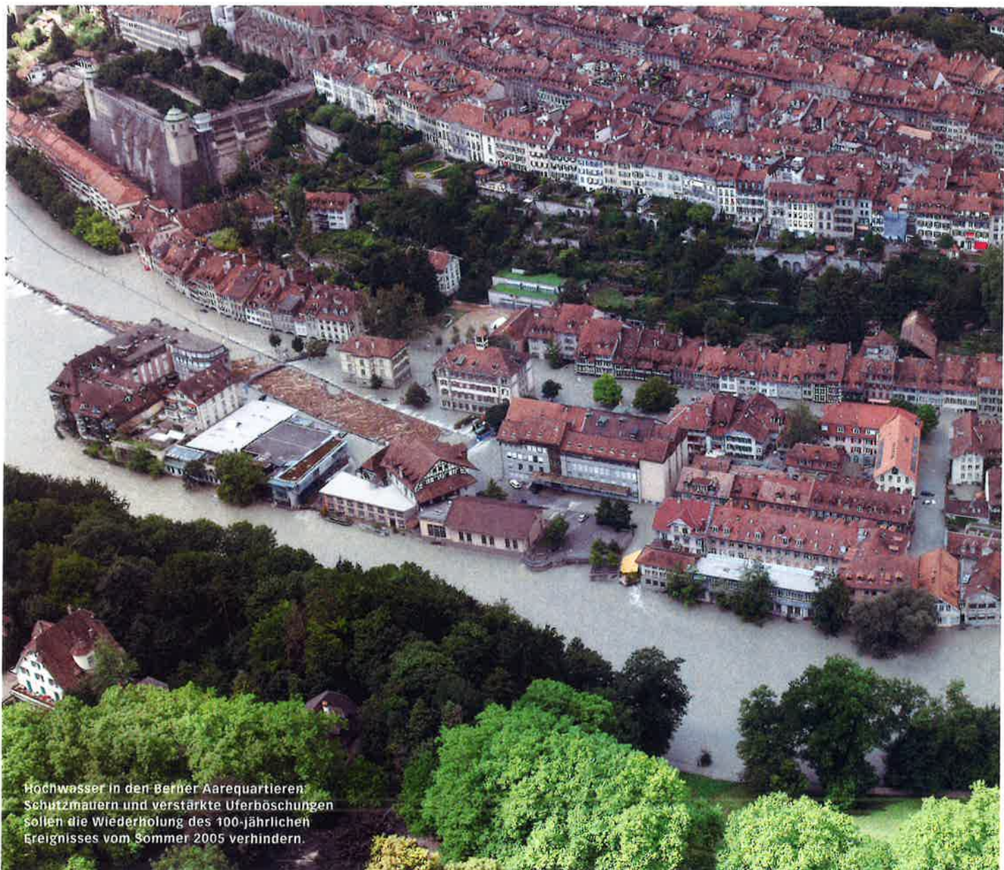
Hochwasser in den Berner Aarequartieren: Schutzmauern und verstärkte Uferböschungen sollen die Wiederholung des 100-jährlichen Ereignisses vom Sommer 2005 verhindern.