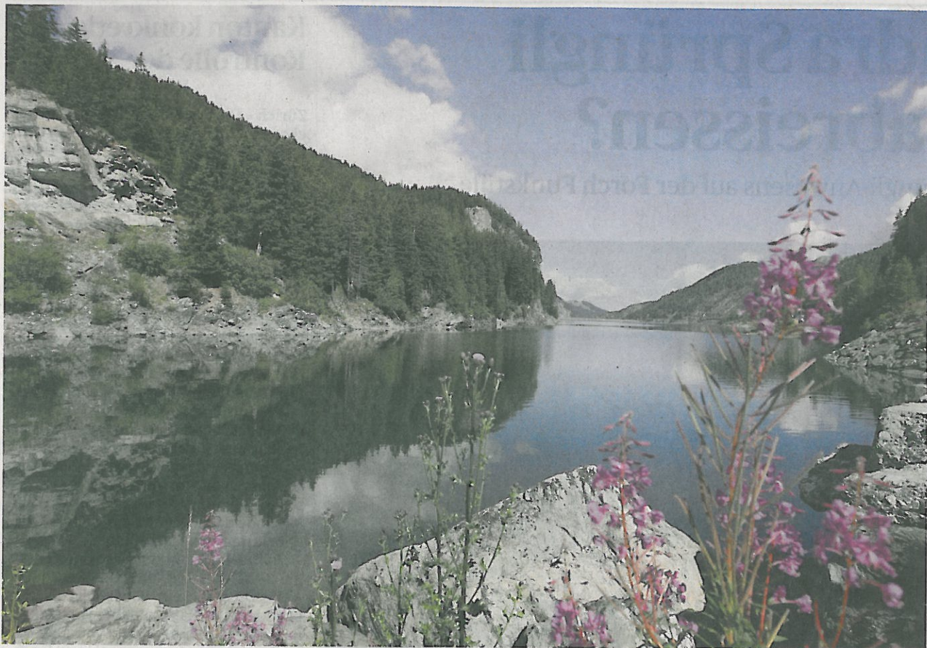
Mitten im Stausee am Julier soll die «Waterlily» genannte Solarstrominsel (Bild unten) zu stehen kommen.